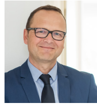
Christoph Böck Erster Bürgermeister